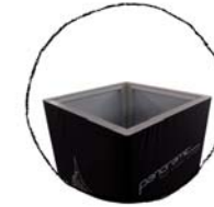
panoramic full visual system